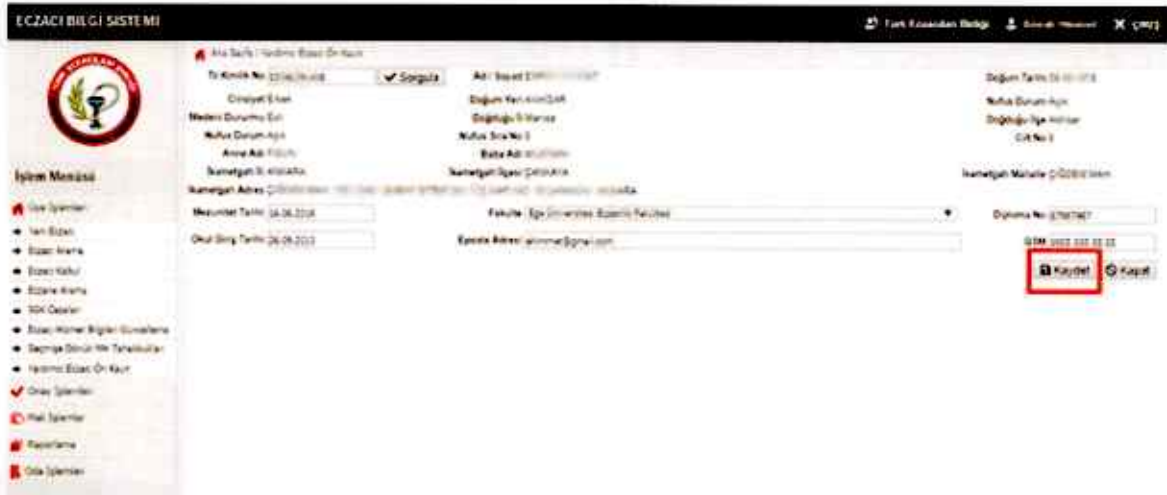
Resim – 3

T.C. Kimlik Paylaşım sisteminin çalışmadığı veya T.C. Kimlik numarasının bulunmadığı durumlarda Yardımcı Eczacı Ön Kayıt sistemi bilgilerin manuel girişine izin vermektedir. (Resim – 4)